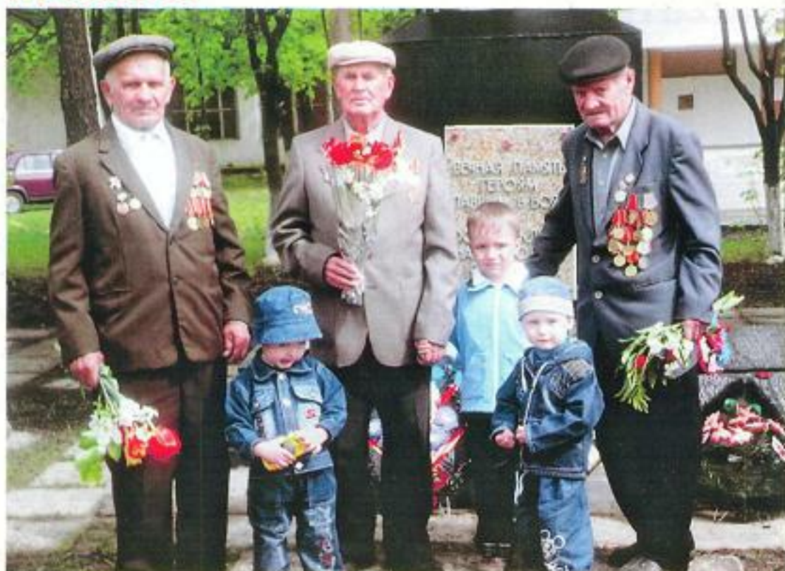
Автор Суслов Андрей Михайлович с. Малакеево Маленькие потомки больших героев