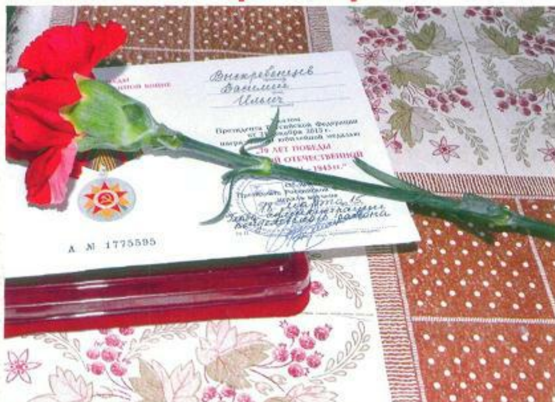
Автор Чужинова Валерия с. Большие Липяги Медали памяти